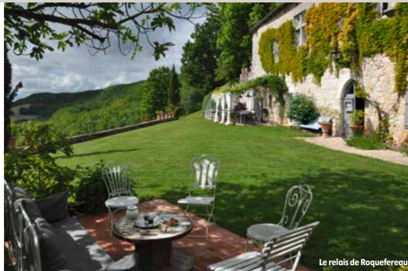
Le relais de Roquefereau

Chambre double à partir de 280 €, petit-déjeuner compris.