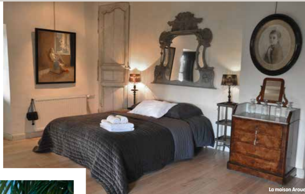
La maison Arouet