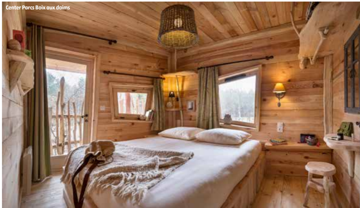
Center Parcs Boix aux daims

Simple et élégante à la fois, cette ancienne maison familiale caractéristique d'un bâti balnéaire plus que centenaire a été restaurée avec soin dans le respect de l'architecture locale et avec des matériaux écologiques. Elle abrite aujourd'hui quatre chambres d'hôtes, ainsi qu'un gîte dans la cour de ferme. Chambre double à partir de 70 €, petit-déjeuner compris.