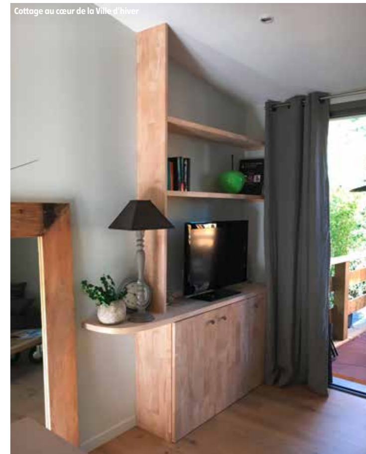
Cottage au cœur de la Ville d'hiver

Chambre double à partir de 160 € pour deux nuits, petit-déjeuner compris.