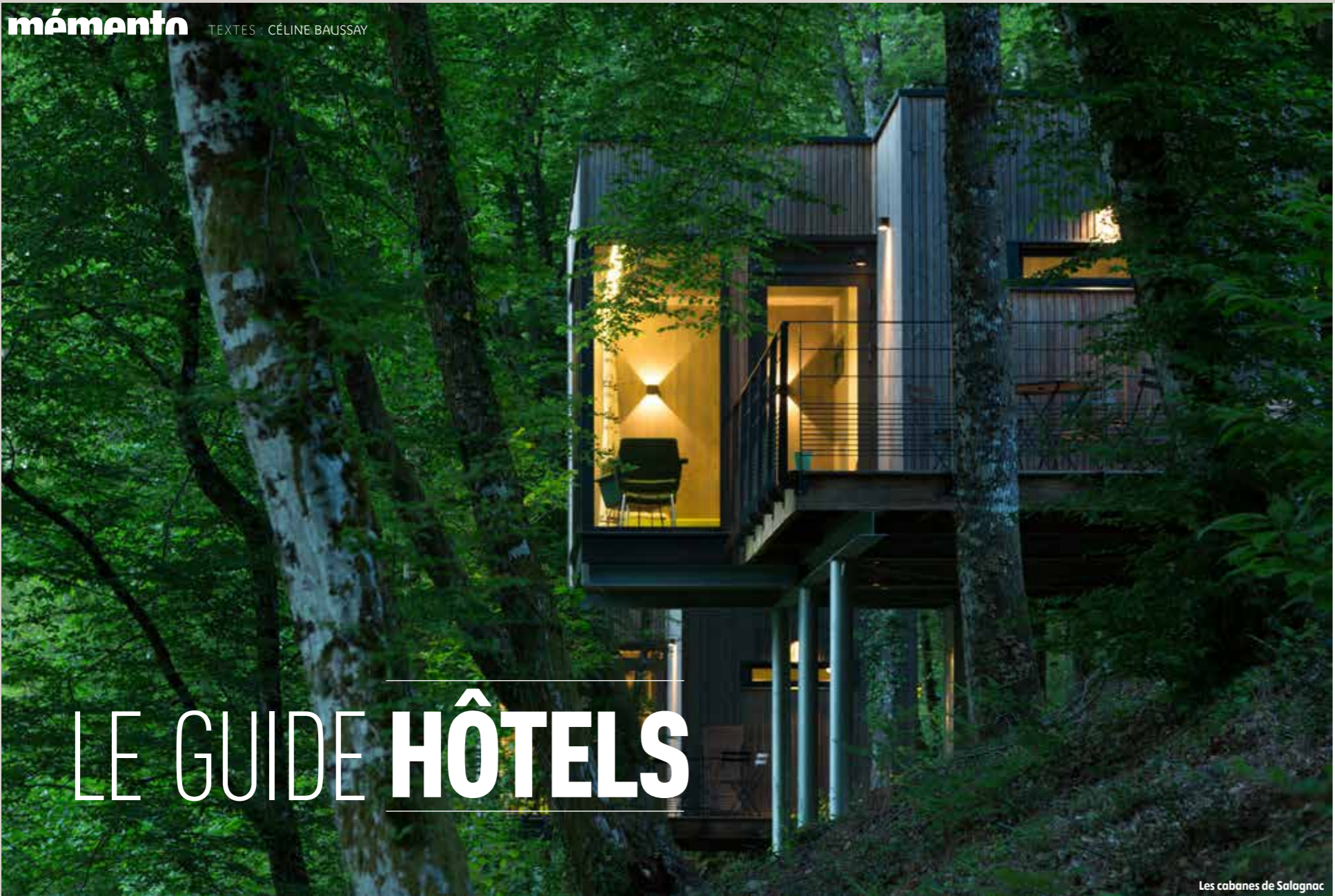
Les cabanes de Salagnac